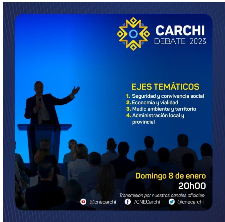
Ejes temáticos abordados