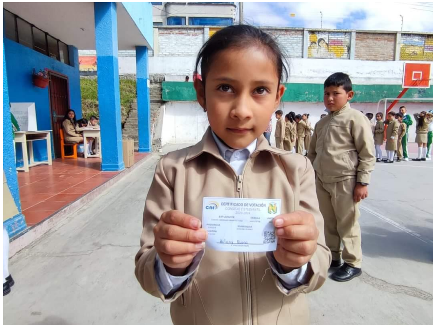
Entrega de certificado