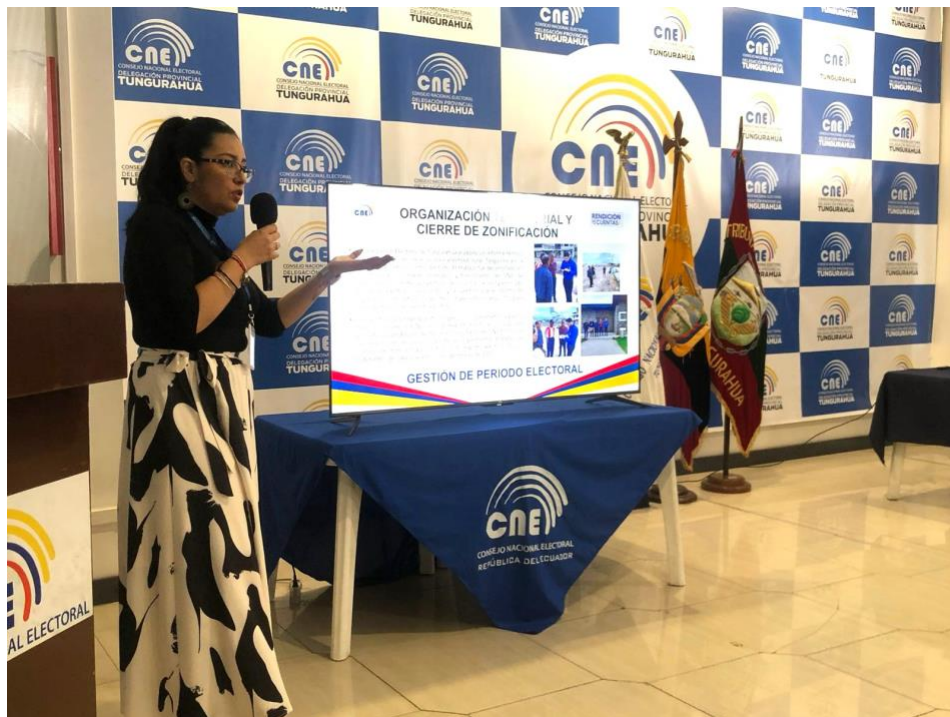
Ilustración 2. Deliberación Máxima autoridad evento Rendición de cuentas 2024 - CNE DPET