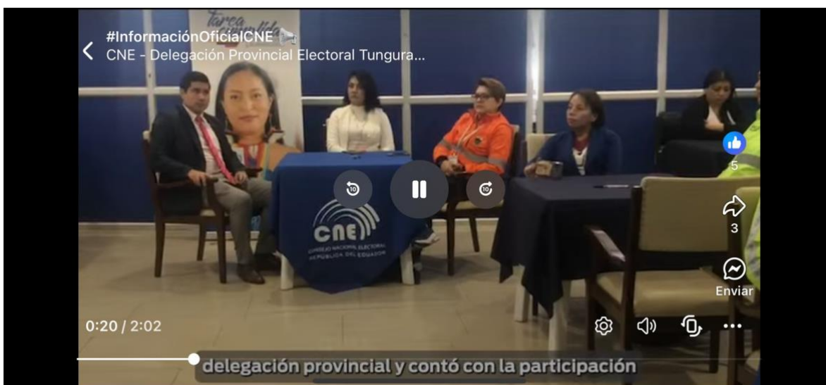
Fotografías realización del evento 17 JUNIO de 2025 Rendición de cuentas CNE TUNGURAHUA 2024: