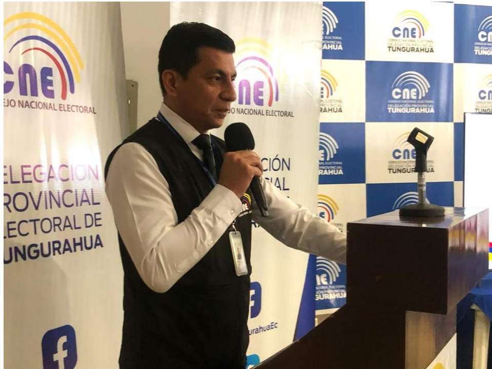
Ilustración 1. Presentación del evento de Rendición de cuentas 2024 CNE TUNGURAHUA