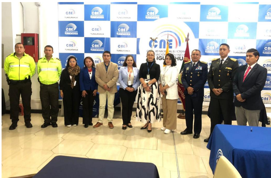
Ilustración 6. Finalización del evento de rendición de cuentas, autoridades e invitados