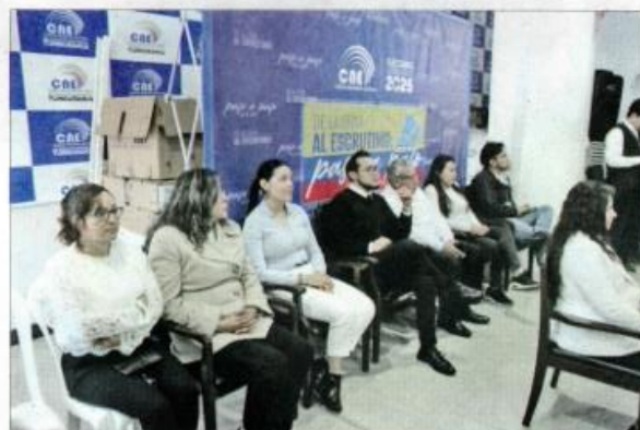
Representantes de varias instituciones asistieron al proceso de rendición de cuentas del organismo electoral provincial en sus instalaciones.

La autoridad resaltó que el presupuesto del Referéndum y