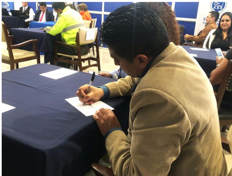
Ilustración 5. Aportes y observaciones de la gestión en evento de Rendición de Cuentas 2024 CNE DPET