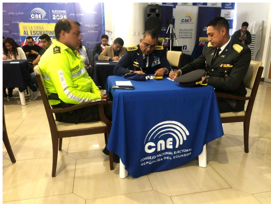
Ilustración 4. Autoridades invitadas en mesas de trabajo rendición de cuentas 2024