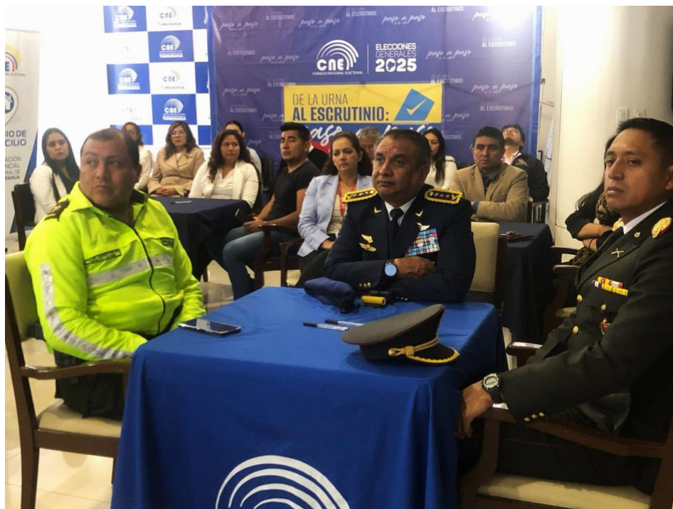
Ilustración 3. Muestra de asistentes evento rendición de cuentas 2024- CNE TUNGURAHUA