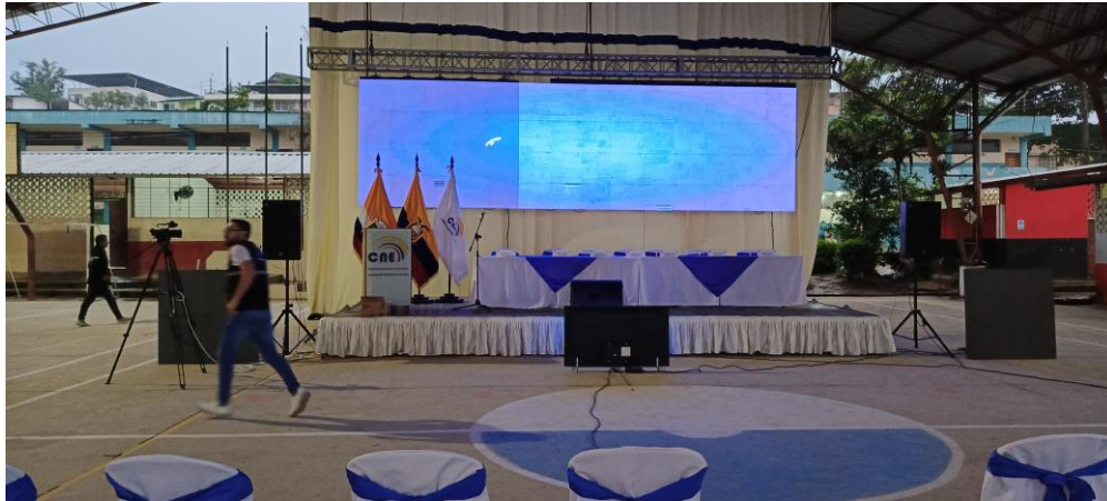
SESIÓN DE ESCRUTINIO: 22 de abril de 2024, realizado en el Auditorio de la Delegación Provincial de Napo