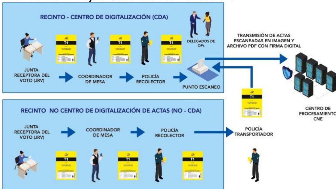
Ilustración No. 7: Flujo de actas de escrutinios hasta el CDA