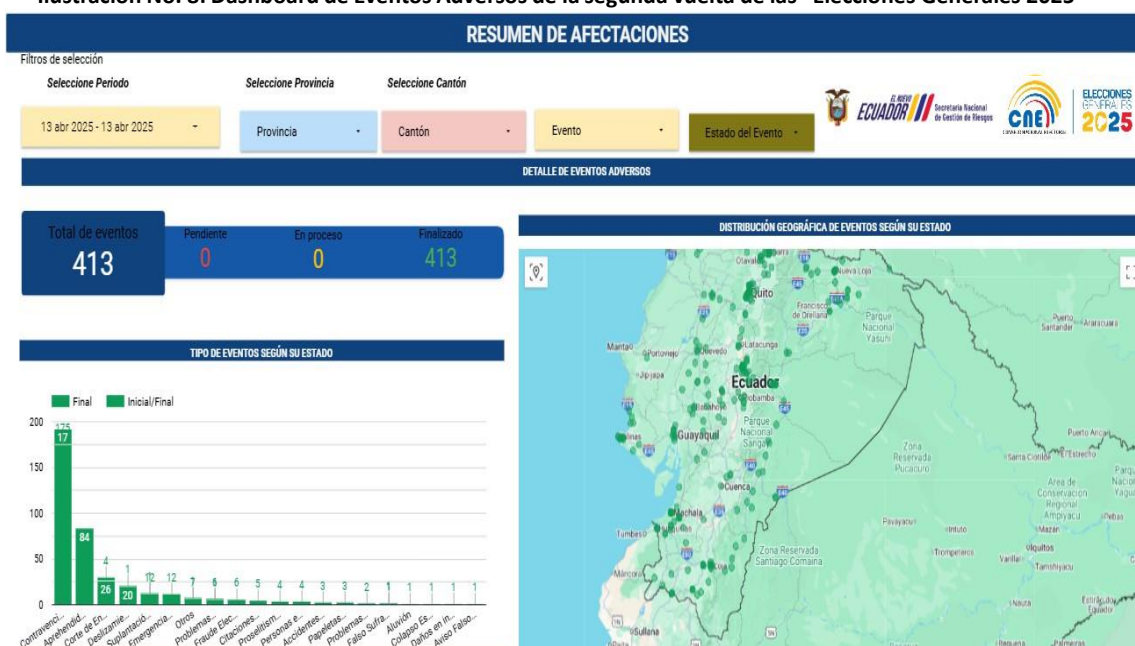
Ilustración No. 8: Dashboard de Eventos Adversos de la segunda vuelta de las “Elecciones Generales 2025”

En el siguiente gráfico se muestra el Dashboard utilizado durante la segunda vuelta de las “Elecciones Generales 2025” con el detalle de los eventos adversos que se suscitaron durante la jornada electoral.