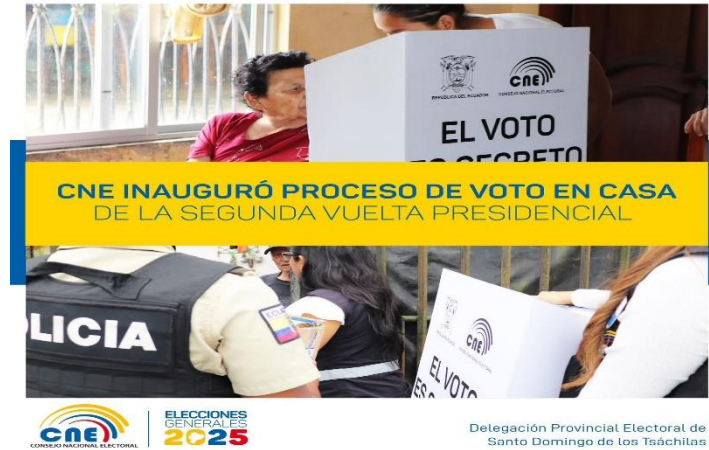
Delegación Provincial Electoral de Santo Domingo de los Tsáchilas