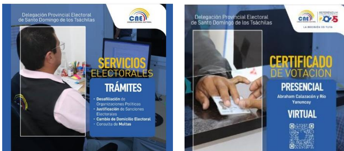
Tabla No. 86: Matriz Resumen de trámites gestionados en la Unidad de Gestión Documental

Durante el periodo comprendido entre enero y diciembre del año 2025 la Secretaría General ha recibido un total de 7227 trámites ingresados por usuarios externos (Ciudadanía, Organizaciones Políticas y Sociales, Instituciones Públicas y Privadas) a través de la ventanilla de recepción documental. Dicha cifra corresponde al registro acumulado desde enero hasta el 31 de diciembre del año 2025.