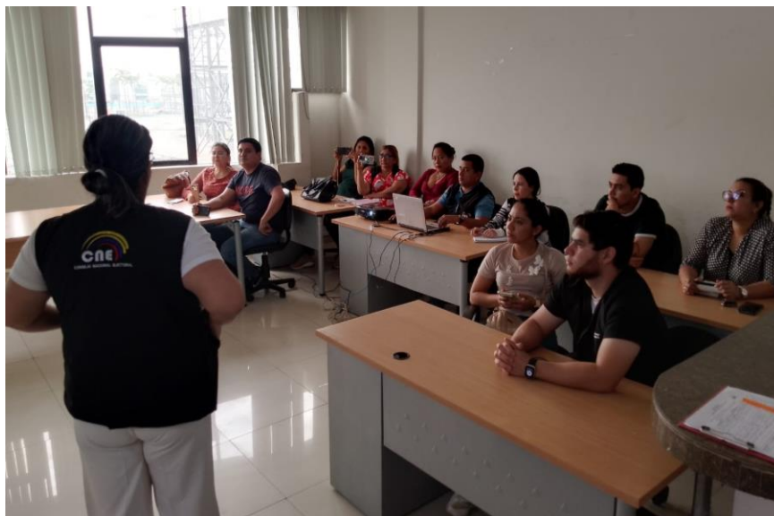
Ilustración 14: Capacitación de SICOFIP a Organizaciones Políticas