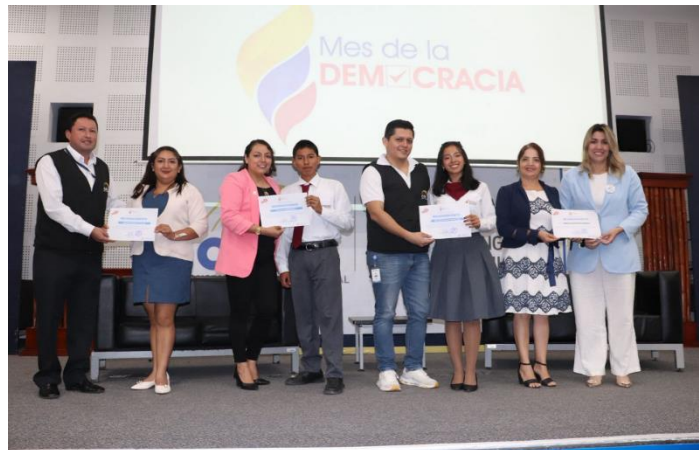
Ilustración 15: Mes de la Democracia