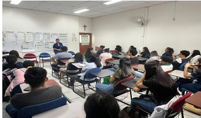
Tabla No. 1: Resultados de Capacitación a actores electorales “Elecciones Generales 2025”

El Consejo Nacional Electoral implementó un refuerzo virtual complementario a la capacitación presencial, disponible en la plataforma institucional a través del enlace: https://capacitacionelectoral.cne.gob.ec .