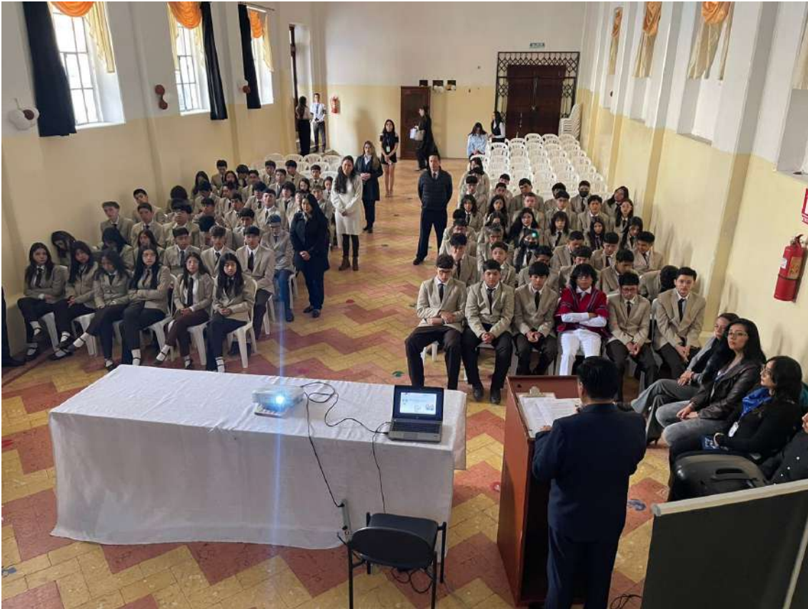
CHARLA: CAPACITACIÓN VIOLENCIA POLITICA DE GENERO (UNIANDES)