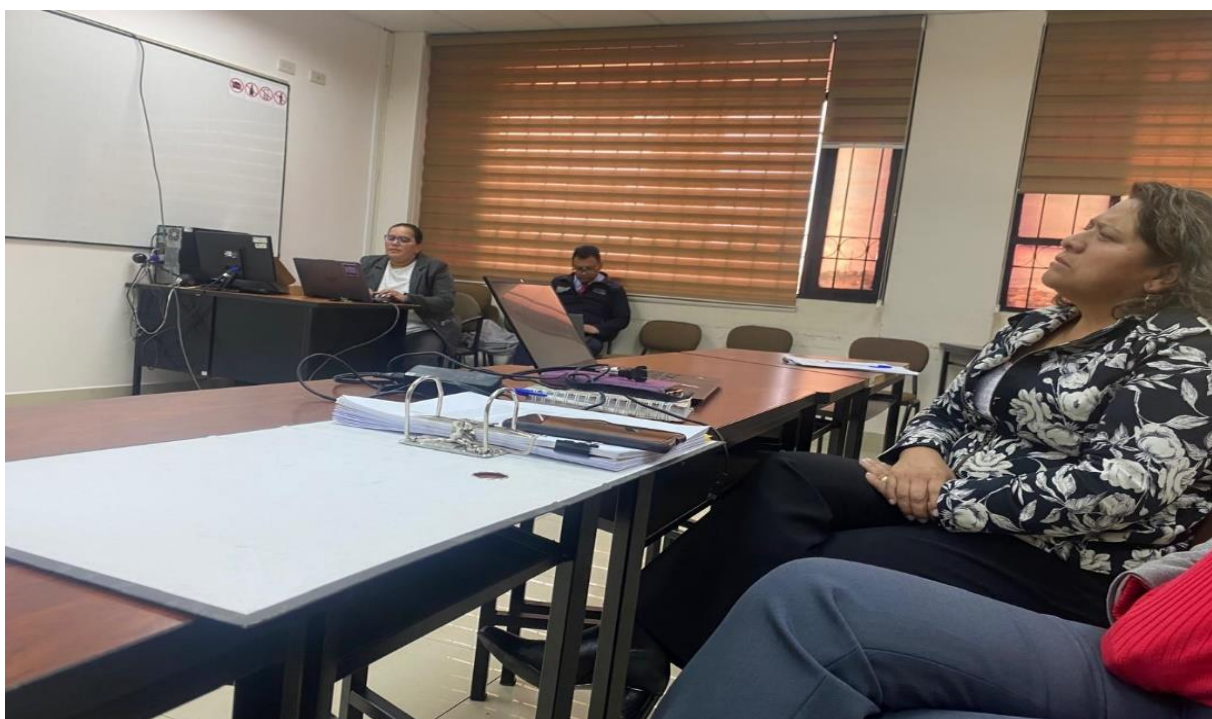
Ilustración 2. Funcionalidad del Módulo Elecciones.