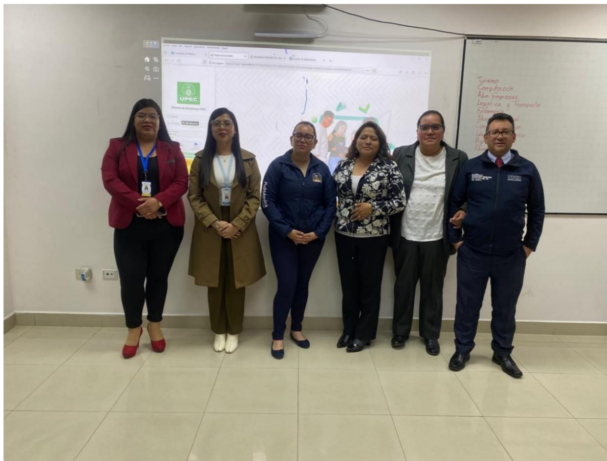
Ilustración 3. Enceramiento de la base de Datos.