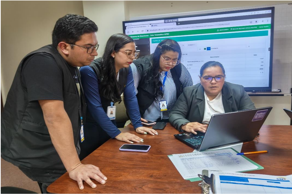
Ilustración 6. Supervisión del Total de Votos obtenidos de Estudiantes y Empleados/ trabajadores