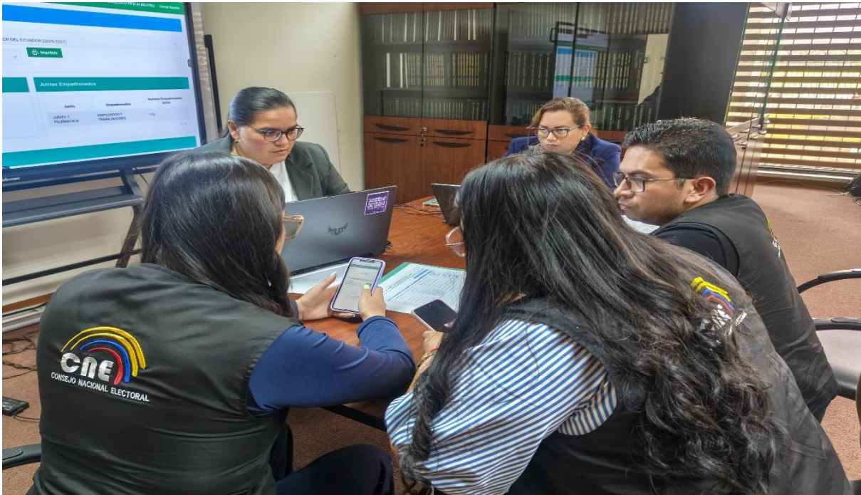
Ilustración 7. Usuario Veedor del Sistema Modulo Elecciones