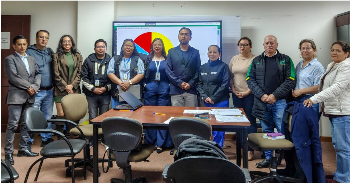
Ilustración 8. Proclamación de Resultados.