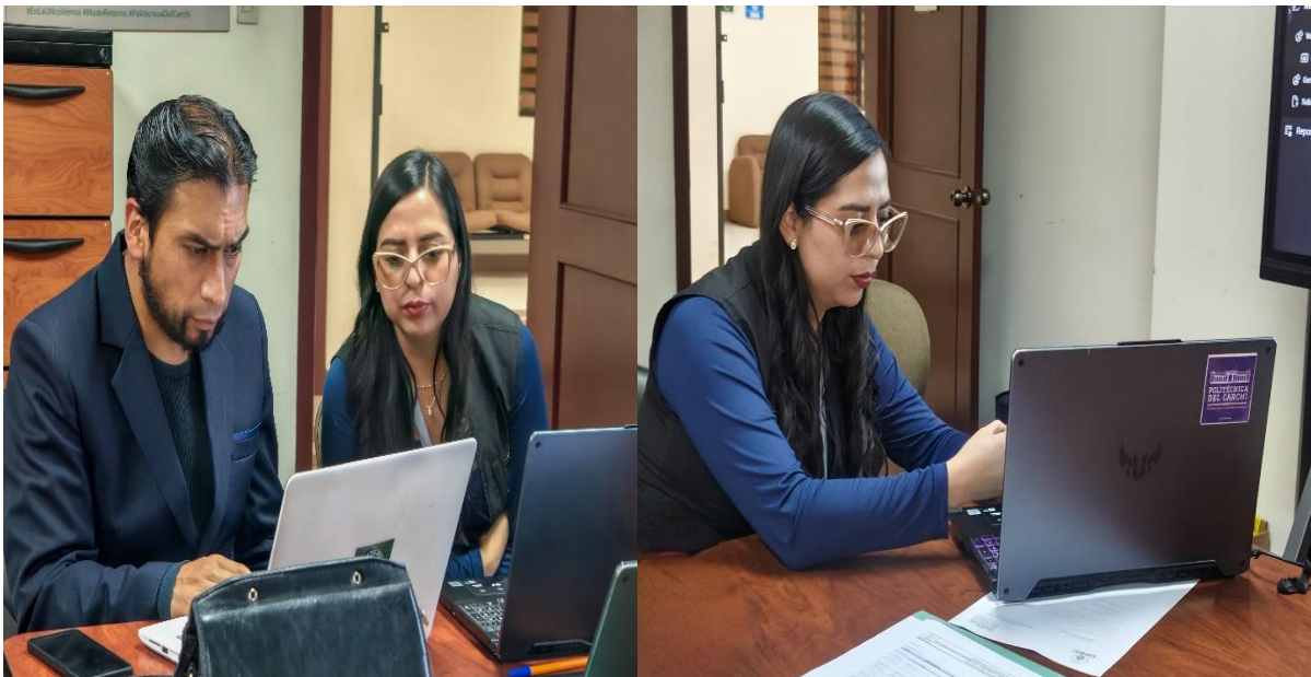
Ilustración 5. Verificación con el presidente del tribunal electoral del Cierre automático a las 17h00 del sistema de Voto telemático.