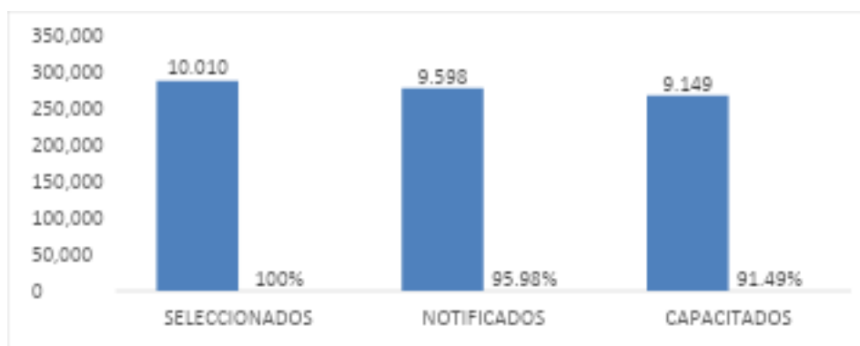
Gráfico No. 3: Miembros de las Juntas Receptoras del Voto (MJRV) Seleccionados, Notificados y Capacitados