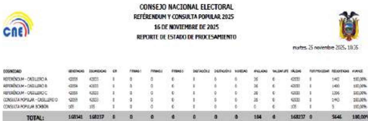
Ilustración No. 17: Estado de Procesamiento

El domingo 16 de noviembre de 2025, se realizó las elecciones de Referéndum y Consulta Popular 2025 , donde los electores acudieron a los recintos electorales a ejercer su derecho al voto.