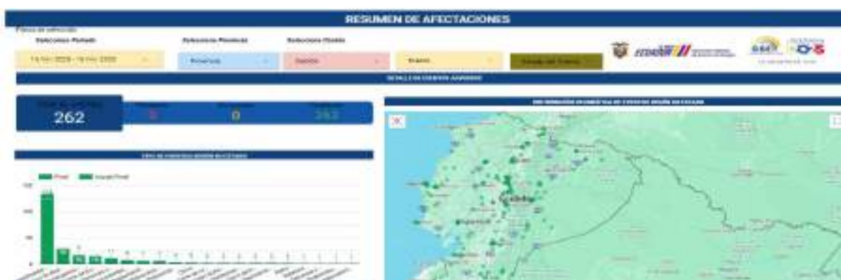
Ilustración No. 19: Eventos adversos