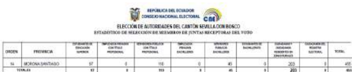
Ilustración No. 10: Total Miembros de las Juntas Receptoras del Voto (MJRV) Seleccionados

Según el reporte generado en el sistema de selección de Miembros de las Juntas Receptoras del Voto (MJRV) se eligieron 97 estudiantes de educación superior, 110 servidores públicos con título profesional, 45 servidores públicos bachilleres, 203 ciudadanos residentes en zonas rurales, dando un total de 455 miembros de las juntas del voto seleccionados.