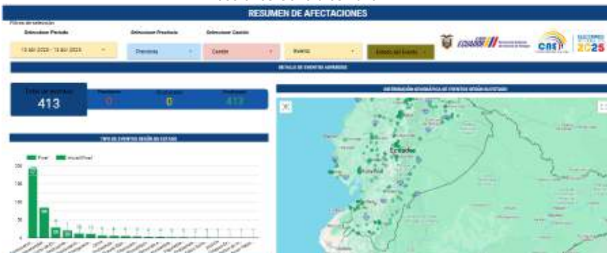
Ilustración No. 9: Dashboard de Eventos Adversos de la segunda vuelta de las “Elecciones Generales 2025”